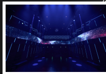
地下4階 Z HALL